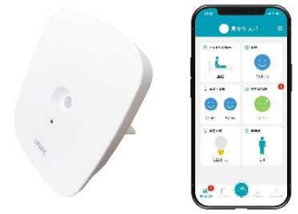
高齢者生活支援 LASHIC 新しいスタイルの見守り

少子高齢化が進み、静岡でも一人暮らしの高齢者、家族や孫が日中不在になり昼間のみ一人で過ごす高齢者が増えています。これからの時期は、室内でも熱中症になり救急搬送される高齢者が多いことから、部屋に設置したセンサーが“いつもと違う”異常を感知しお知らせしてくれる LASHIC（ラシク）シリーズを展示いたします。LASHIC はインフィックが介護の知見をもとに開発した IoT・AI を活用した高齢者生活支援システムで、生活のさまざまな異変を家族へお知らせする機能が充実。IoT 機器で高齢者お一人の時間でも安心安全な空間をご提案いたします